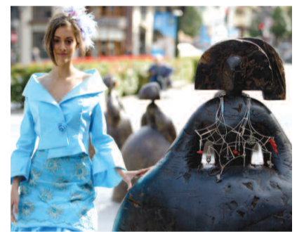
Una de las meninas de Manolo Valdés

El pasado mes de noviembre, la organización Creasmoda (Asociación de Creadores de Moda del Principado de Asturias) organizó el desfile “Tendencias” como apoyo a la difusión de la joyería creativa y de la moda en general.